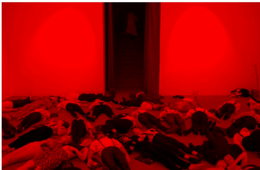
KROPSEANCE. Som var det én stor fælles organisme, samles elever og undervisere til kollektivt ritual i det røde rum.

bedt om at fortælle om et minde forbundet med den duft – pludselig er vi langt væk i barndommen. Vores befriende umiddelbare underviser fortæller om de mange flasker på hylderne over os, fyldt med hans erindringer i form af blegnede spøgelseshvide blomster og planter svømmende rundt i klar væske.