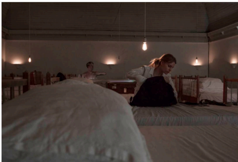
DRØMMETID. Snortlige står køjesengene i den hvide sovesal som modsvar til den sorte og røde afdeling på kostskolen.