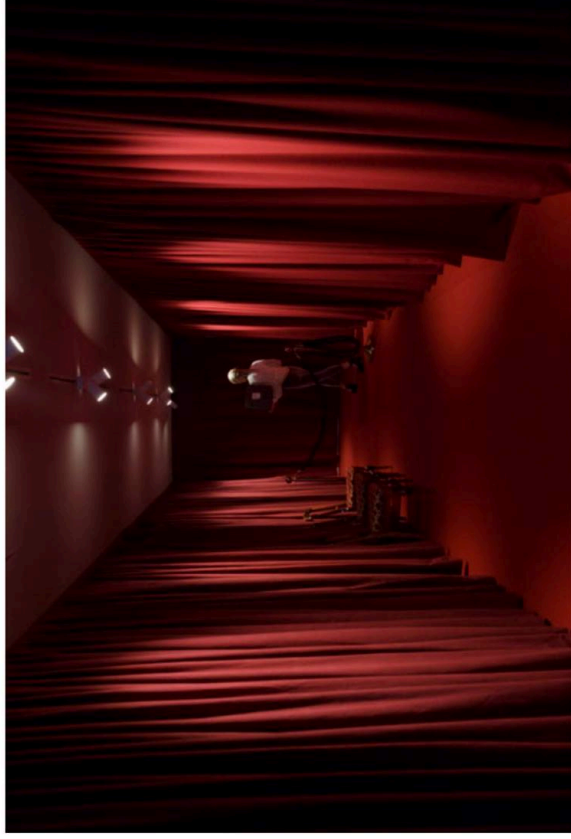
UNDERTONE. Der lægges op til Twin Peaks-stemming i underretagen, men der kunne godt være flere ugler i mosen i det hele taget.

Smukt, men også lidt spooky - som fra en anden tid, der trænger sig på. Herfra er der langt til vores ramsaltede hundesnuseri.