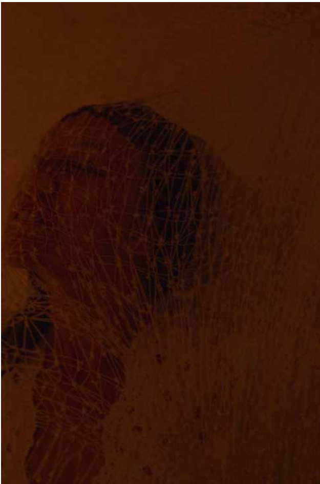
Billede 9: The Untamed in her tableaux. Sisters Academy #3 - The Boarding School by Sisters Hope.

Derfor lyder "the Untamed" poetiske selvbiografi således: