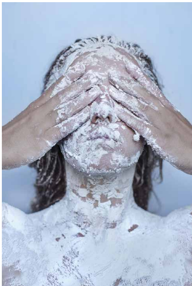
Billede 8: The Untamed, Sisters Hope.

De Sanselige Læringsklasser tager, ligesom konstruktionen af ens tableau, udgangspunkt i det poetiske selv. The Untamed undersøger f.eks. sanseligheden i 'utæmmende' strukturer.