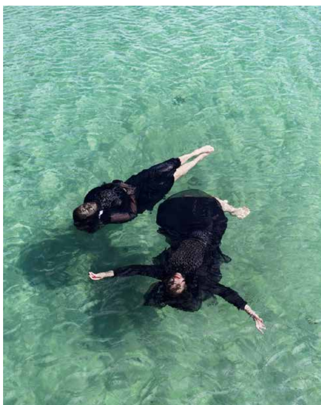
Billede 1 og Billede 2: Fertilization - Leaps of preparations for Sisters Academy - The Boarding School af Sisters Hope på Den Frie Udstillingsbygning som vindere af Udstillingsprisen VISION.