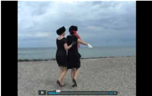
The Sisters in search of their poetic selves: https://vimeo.com/16651126